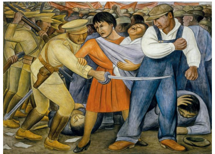
Diego Rivera. A Revolta.

O quadro de Diego Rivera aponta para um conflito marcante que choca o público devido a